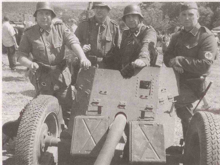
Po skončení ukážok bojov prišiel čas i na spoločné fotografie.