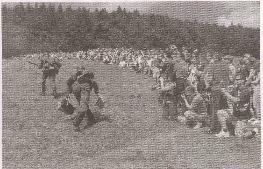
Ukážkam bojov na Kopcovom sa prizeralo takmer 2000 prítomných, pohľad na časť z nich.