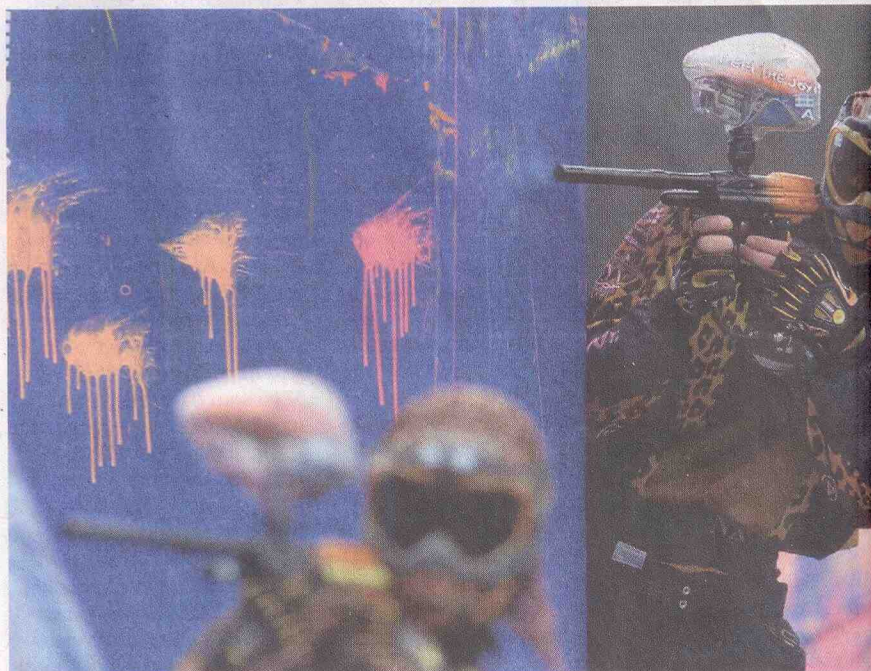
Paintball má aj military vetvu, skutoční paintballisti sa však považujú za športovcov.